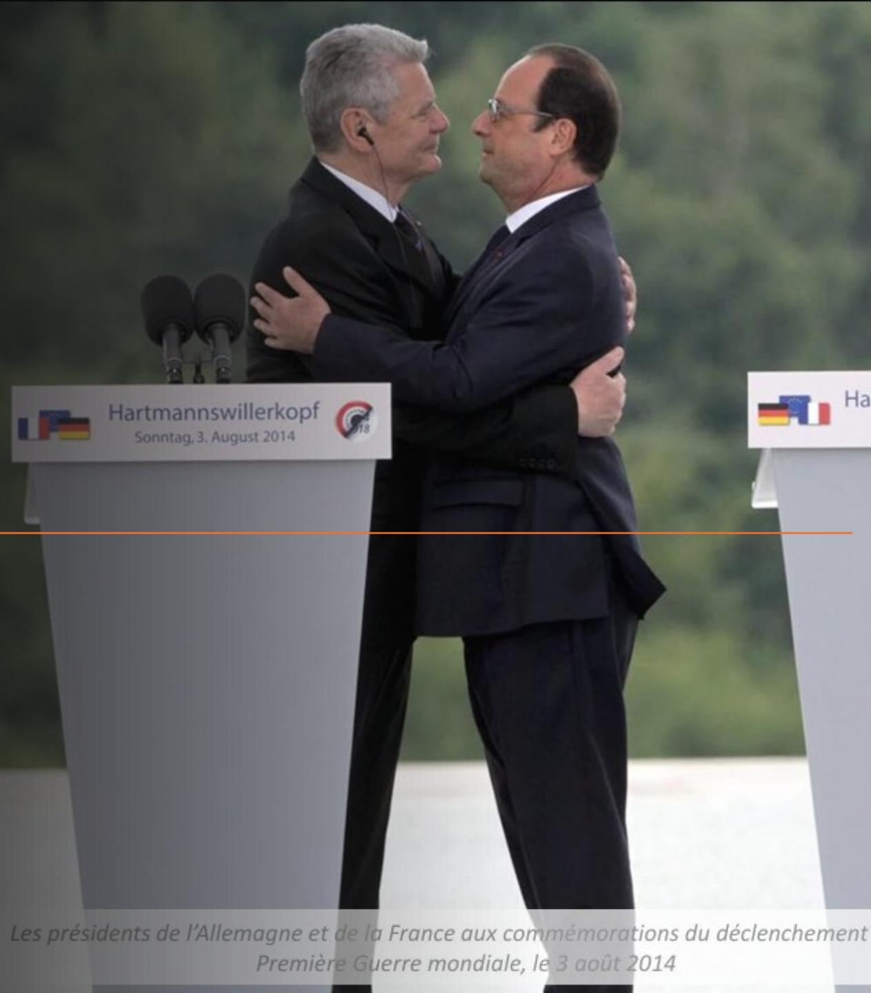
Les présidents de l'Allemagne et de la France aux commémorations du déclenchement Première Guerre mondiale, le 3 août 2014